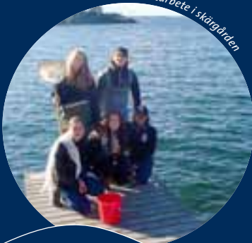
Fältarbete i skärgården