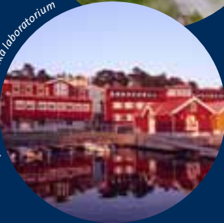
Tjärnö marinbiologiska laboratorium